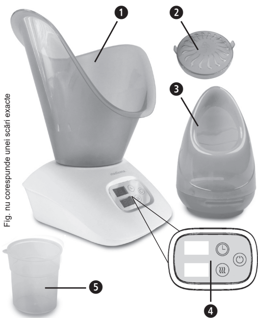
Fig. nu corespunde unei scări exacte