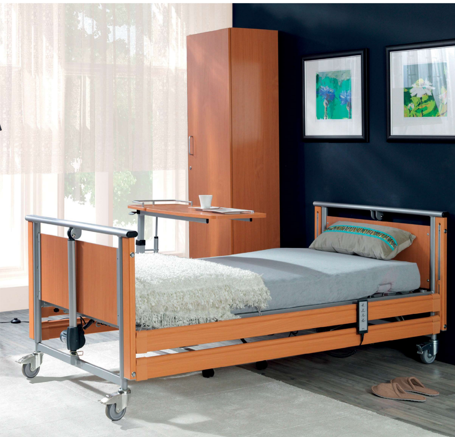
Na zdjęciu: łóżko PB 326 w wykonaniu standardowym w kolorze buk. Akcesoria: stolik Rubens 3 w kolorze buk.

Nasze uniwersalne łóżko PB 326 ze swoim atrakcyjnym wyglądem łatwo integruje się w wielu środowiskach. Komfort dla użytkownika zapewniony poprzez różnorodne funkcje, jak również ergonomia pracy opiekunów powodują, że jest to produkt szczególnie ceniony przez właścicieli wypożyczalni sprzętu rehabilitacyjnego oraz indywidualnych odbiorców.