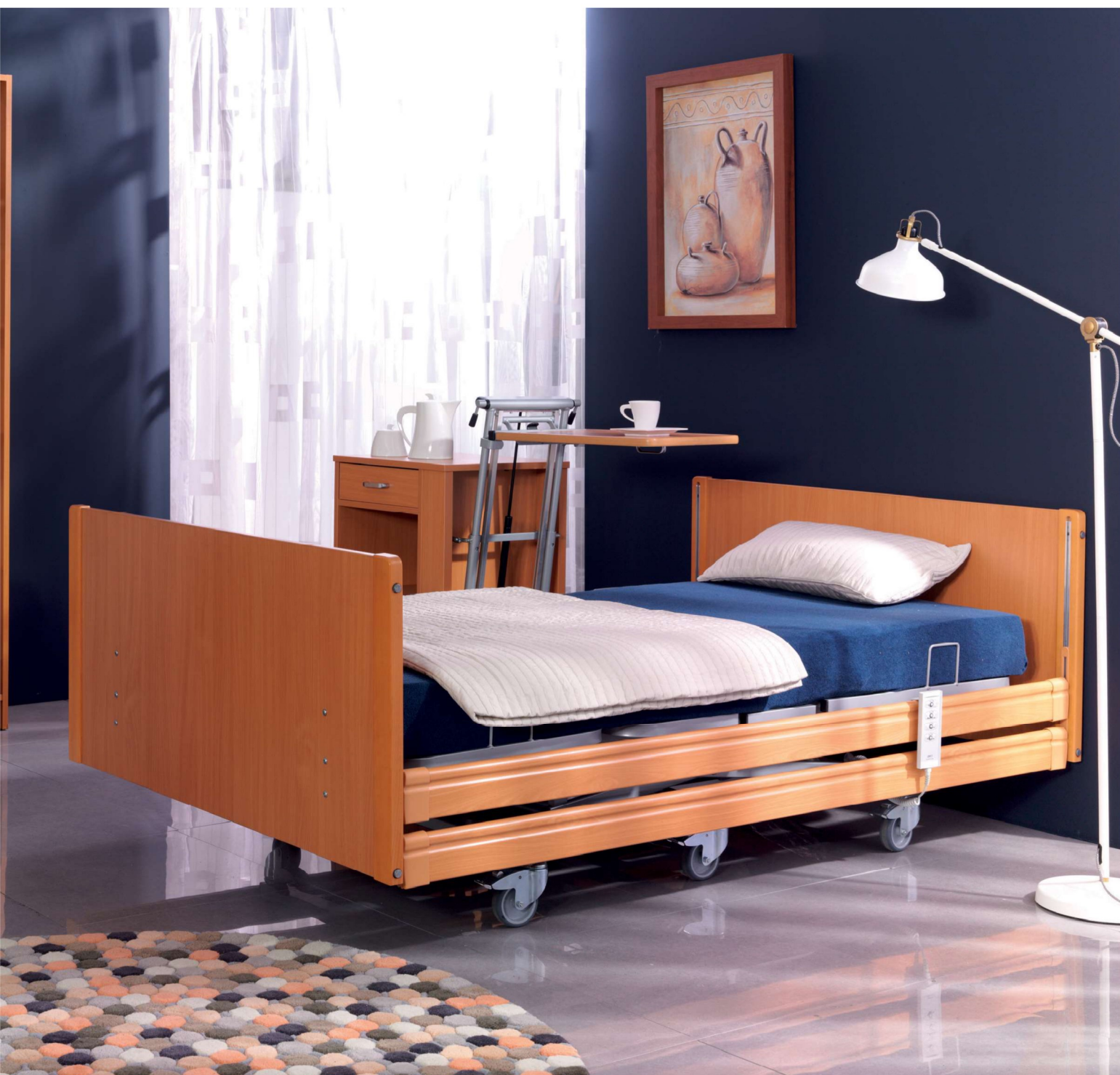
Na zdjęciu: łóżko PB XX4 w kolorze buk, w wykonaniu standardowym. Akcesoria: Szafka Rubens 2 w kolorze buk.

Dzięki wzmocnionej konstrukcji i zastosowaniu specjalnych siłowników do dużych obciążeń, łóżka z serii PB X4 przeznaczone są dla osób o zwiększonej wadze ciała, wymagających opieki długoterminowej. Bardzo stabilna konstrukcja łóżka gwarantuje bezpieczeństwo użytkownika, a wypełnione siatką metalową leże ułatwia jego dezynfekcję.