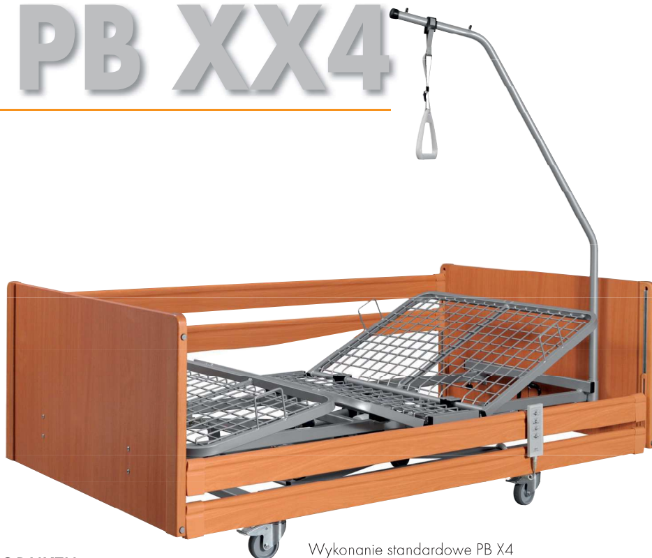
Wykonanie standardowe PB X4