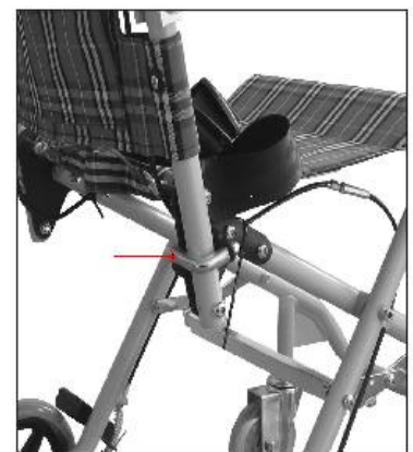
rys. 1 - łącznik bezpieczeństwa

Po rozpakowaniu wózka z torby, należy odpiąć czarna taśmę na zatrzask zabezpieczającą wózek przed samoczynnym rozkładaniem się. Następnie ustawić wózek na kołach, w tym celu należy podnieść oparcie w górę i pociągnąć delikatnie za przednią ramę siedziska. Pomiędzy konstrukcją krzyżakową pod siedziskiem, jest poprzeczka bezpieczeństwa, która należy zablokować podciągając ją w górę. Zabezpiecza ona wózek przed samoczynnym złożeniem się siedziska. Oparcie ma dwa zabezpieczenia – pierwsze, to dwa klipsy z tyłu siedziska, które „wskakują” w ramę oparcia. Drugie, to łączniki bezpieczeństwa, które w trakcie użytkowania muszą być zablokowane jak na rysunku 1. Po takim zmontowaniu wózek jest gotowy do użycia. Po złożeniu wózka, należy sprawdzić wszystkie zabezpieczenia i mocowania. Do wózka są dołączone niezbędne narzędzia. Jeżeli pojawiają się jakiegokolwiek wątpliwości podczas użytkowania podpórki, skontaktować się z punktem sprzedaży.